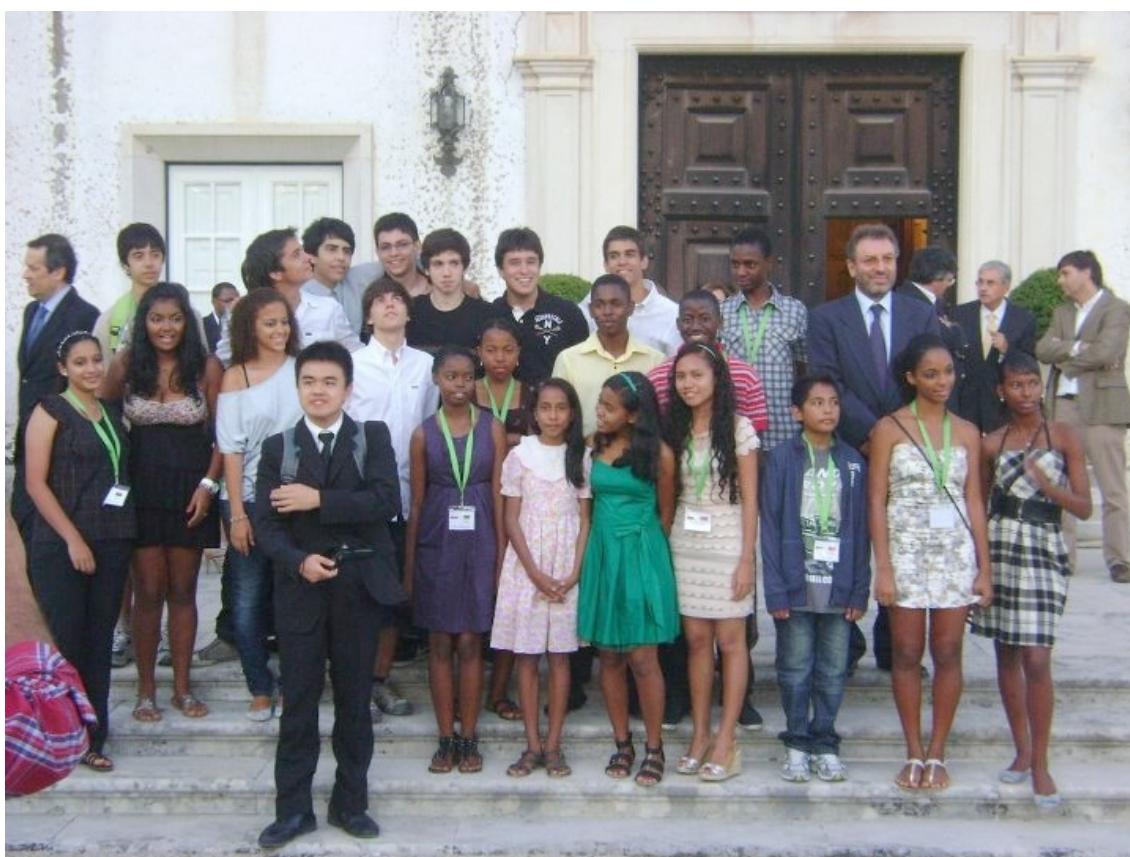
Na entrada do Palácio de São Marcos

Outro acontecimento relevante desta edição das Olimpíadas teve a ver com a realização das 1ª Olimpíadas de Matemática da Lusofonia (OML) que decorreram na Universidade de Coimbra de 20 a 31 de Julho de 2011. A organização foi da responsabilidade do Departamento de Matemática da Faculdade de Ciências e Tecnologia da Universidade de Coimbra, com a colaboração da SPM. Foi graças à iniciativa da SPM, que foi apoiada pelo Ministério da Educação e Ciência, Ciência Viva e Banco Espírito Santo, que foi possível criar esta nova competição internacional entre jovens estudantes de países de língua portuguesa. Alguns dos objectivos desta competição são a melhoria da qualidade de ensino, a descoberta de talentos em Matemática, fundamental para o desenvolvimento científico e tecnológico, fomentar o estudo da Matemática nos países lusófonos e a criação de uma oportunidade para a troca de experiências educacionais nacionais. Nestas Olimpíadas os representantes de Portugal tiveram um desempenho assinalável tendo obtido uma medalha de ouro, uma de prata, uma medalha de bronze e ainda uma menção honrosa.