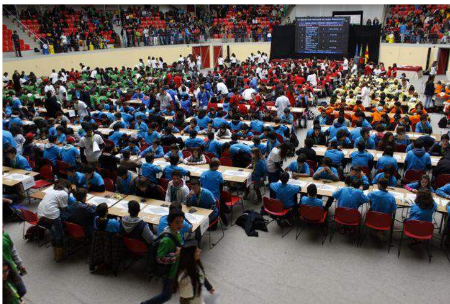
Arena d'Évora durante a final do Campeonato Nacional de Jogos Matemáticos

O CNJM é uma iniciativa da Associação Ludus, da Associação de Professores de Matemática e da SPM com o apoio da Ciência Viva. A organização local da final da 9ª edição foi da responsabilidade da Universidade de Évora, da Câmara Municipal de Évora e da Delegação Regional do Sul e Ilhas da SPM, e contou com o apoio da Escola Profissional da Região Alentejo – EPRAL, Fundação Luís de Molina, BES, Luduscience, Tantrix Portugal ( http://ludicum.org/cnjm/9 ).